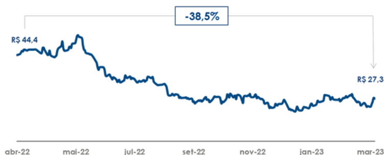
Performance SMTO3 - 12 meses (R$)

As ações da São Martinho, integram o Novo Mercado, mais alto nível de governança corporativa da B3 – Brasil, Bolsa, Balcão, sob o código SMTO3. Em 31 de março de 2023 o capital social da Companhia era representado por 354.011.329 ações ordinárias. A ação (SMTO3) encerrou o ano safra cotada a R$ 27,32, refletindo ajuste de -38,5% no período.